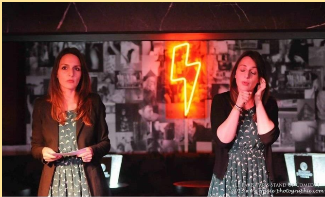
Souvenir de notre 1er passage sur scène en 2013 au "Paris Paris"